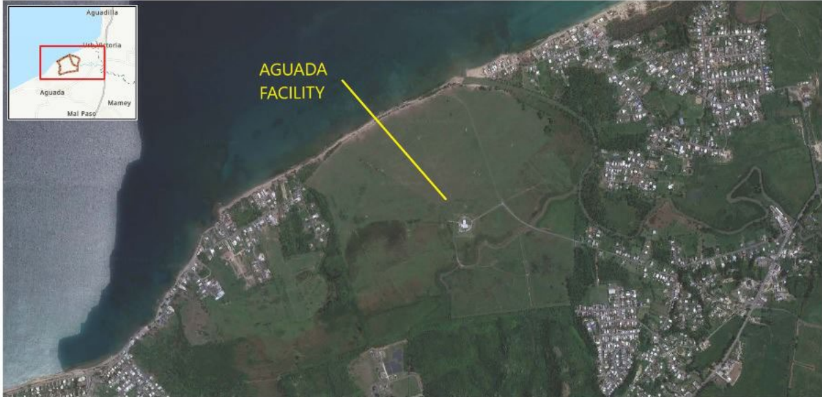
Mapa de Localización: Facilidad de Aguada